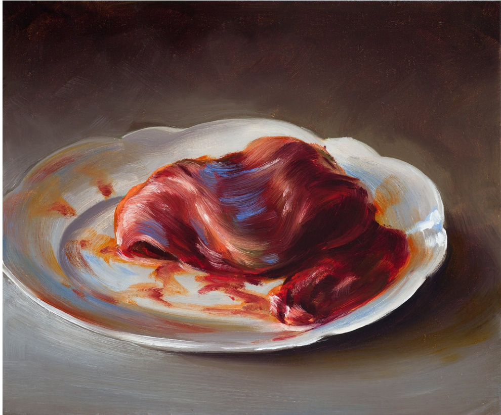
Cornelius Völker Herz, 2023 Öl auf Leinwand 42 x 49 cm Voel/M 247