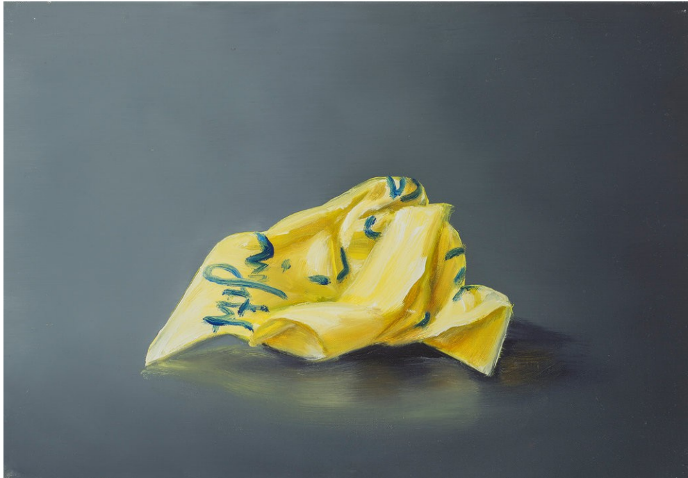
Cornelius Völker Post-it, 2018 Öl auf Leinwand 35 x 50 cm Voel/M 145