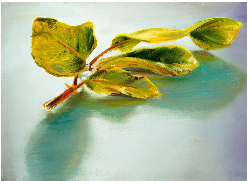
Cornelius Völker Blätter, 2022 Öl auf Leinwand 40 x 55 cm Voel/M 263