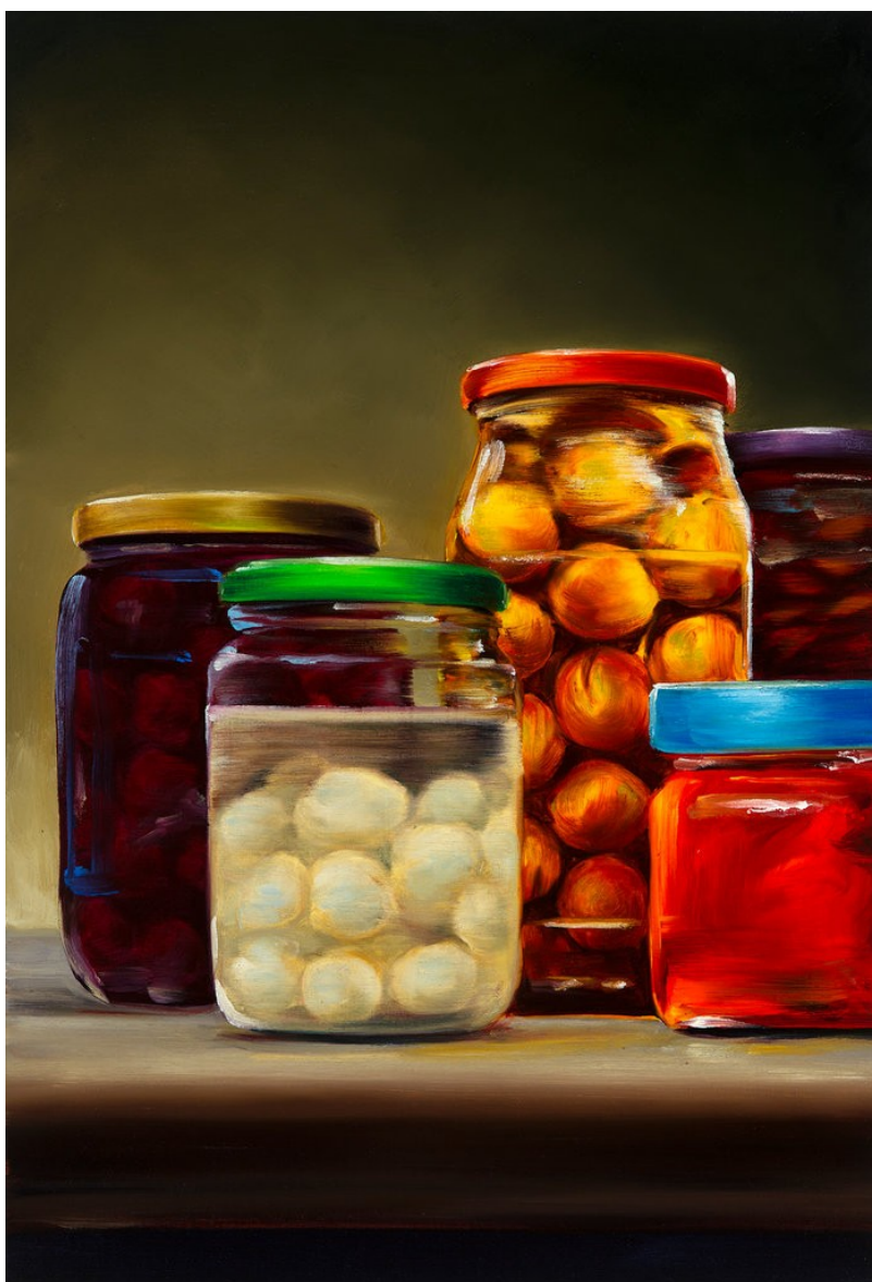
Cornelius Völker Eingelegtes, 2021 Öl auf Leinwand 110 x 75 cm Voel/M 186