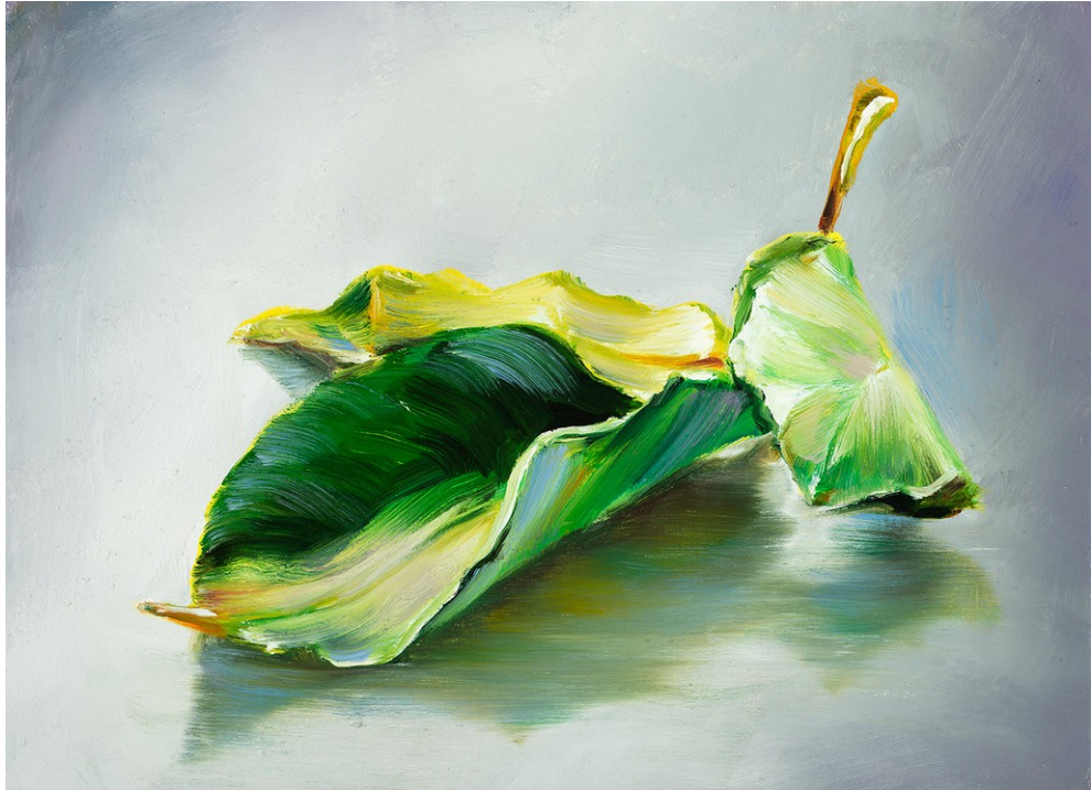
Cornelius Völker Blätter, 2022 Öl auf Leinwand 40 x 55 cm Voel/M 261