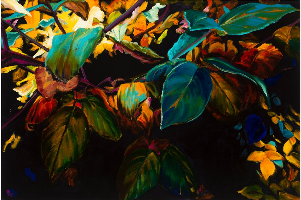
Cornelius Völker Blätter, 2022 Öl auf Leinwand 160 x 240 cm Voel/M 241