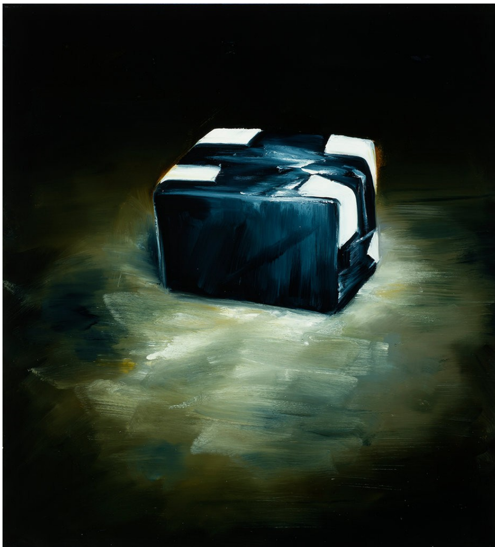
Cornelius Völker Suspicious Package, 2022 Öl auf Leinwand 110 x 100 cm Voel/M 244