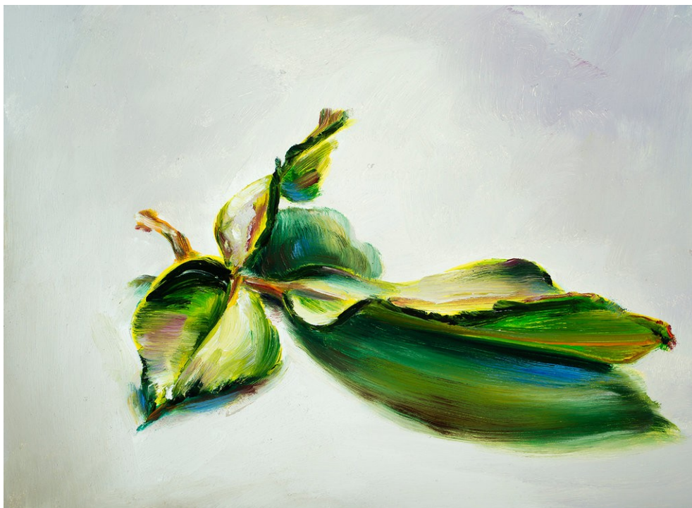
Cornelius Völker Blätter, 2022 Öl auf Leinwand 40 x 55 cm Voel/M 259