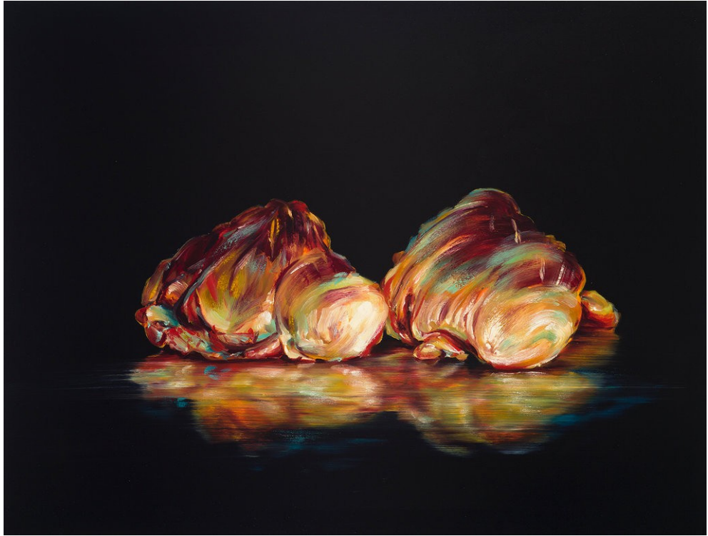
Cornelius Völker Zwei Herzen, 2023 Öl auf Leinwand 130 x 170 cm Voel/M 249