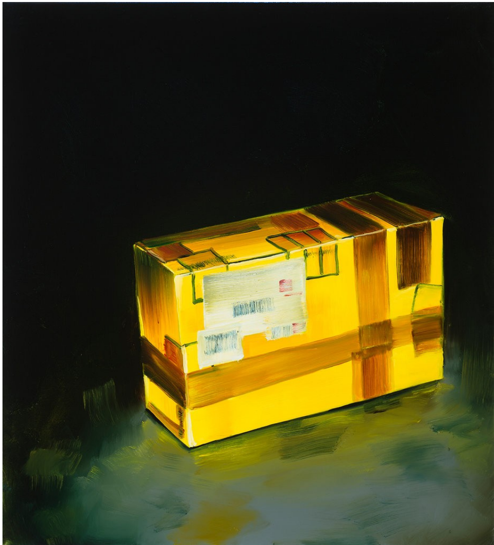
Cornelius Völker Suspicious Package, 2022 Öl auf Leinwand 110 x 100 cm Voel/M 245