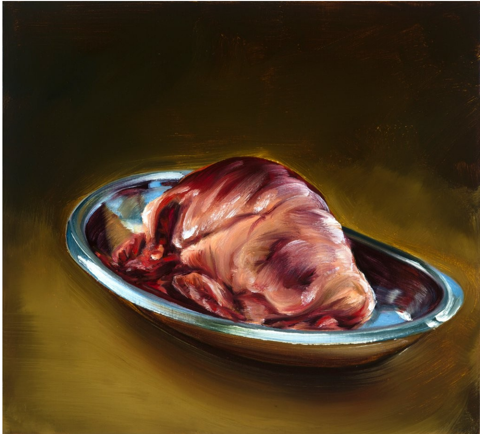
Cornelius Völker Herz, 2021 Öl auf Leinwand 50 x 55 cm Voel/M 250