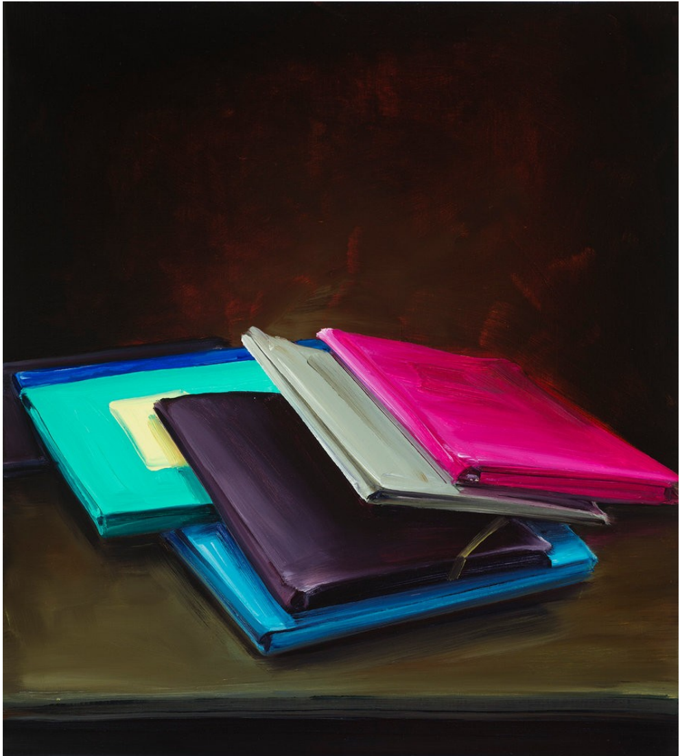
Cornelius Völker Dossier, 2018 Öl auf Leinwand 90 x 80 cm Voel/M 275