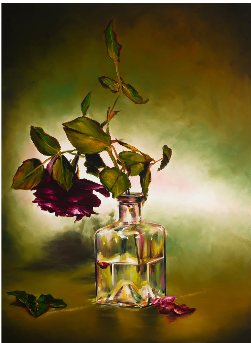
Cornelius Völker Vase, 2023 Öl auf Leinwand 190 x 140 cm Voel/M 274