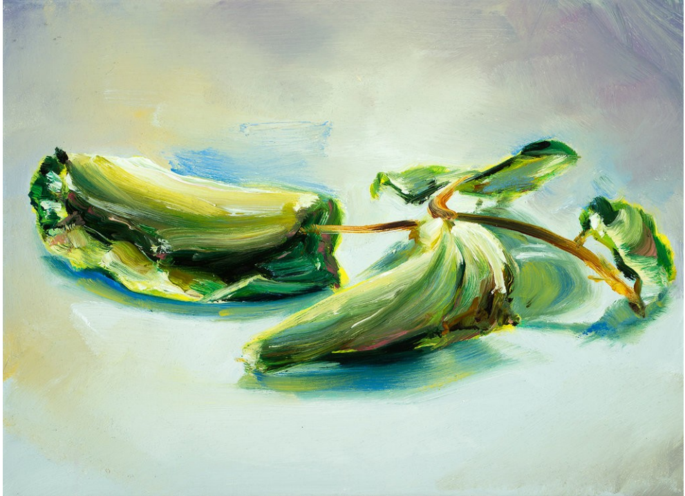
Cornelius Völker Blätter, 2022 Öl auf Leinwand 40 x 55 cm Voel/M 260