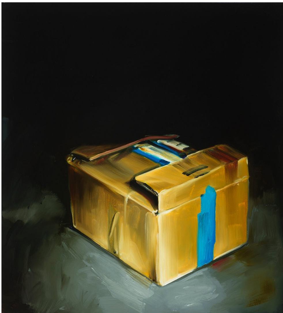
Cornelius Völker Suspicious Package, 2022 Öl auf Leinwand 110 x 100 cm Voel/M 243