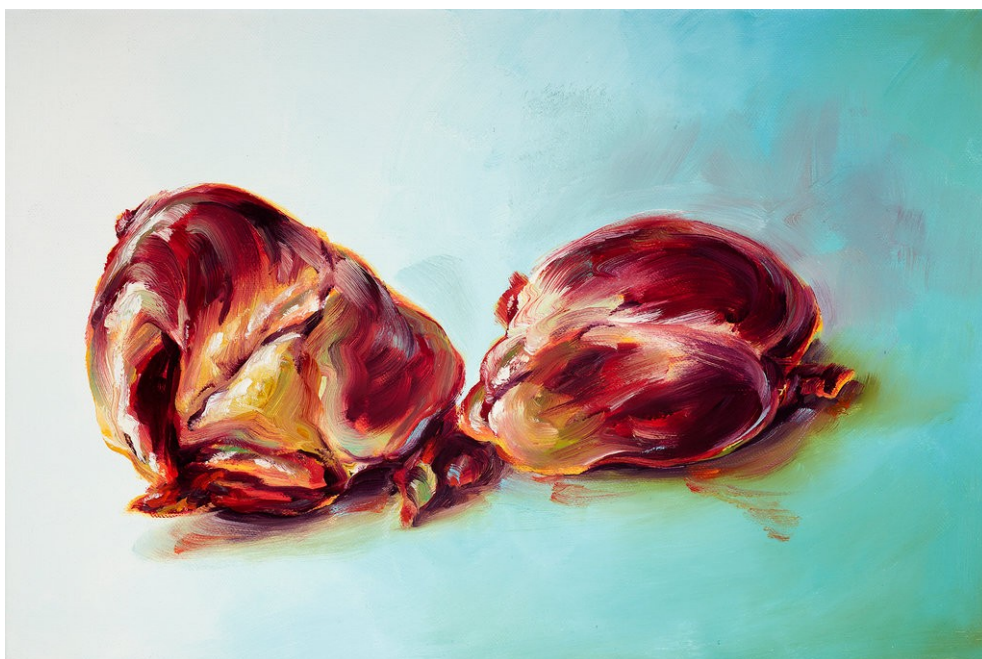
Cornelius Völker Zwei Herzen, 2023 Öl auf Leinwand 50 x 75 cm Voel/M 251