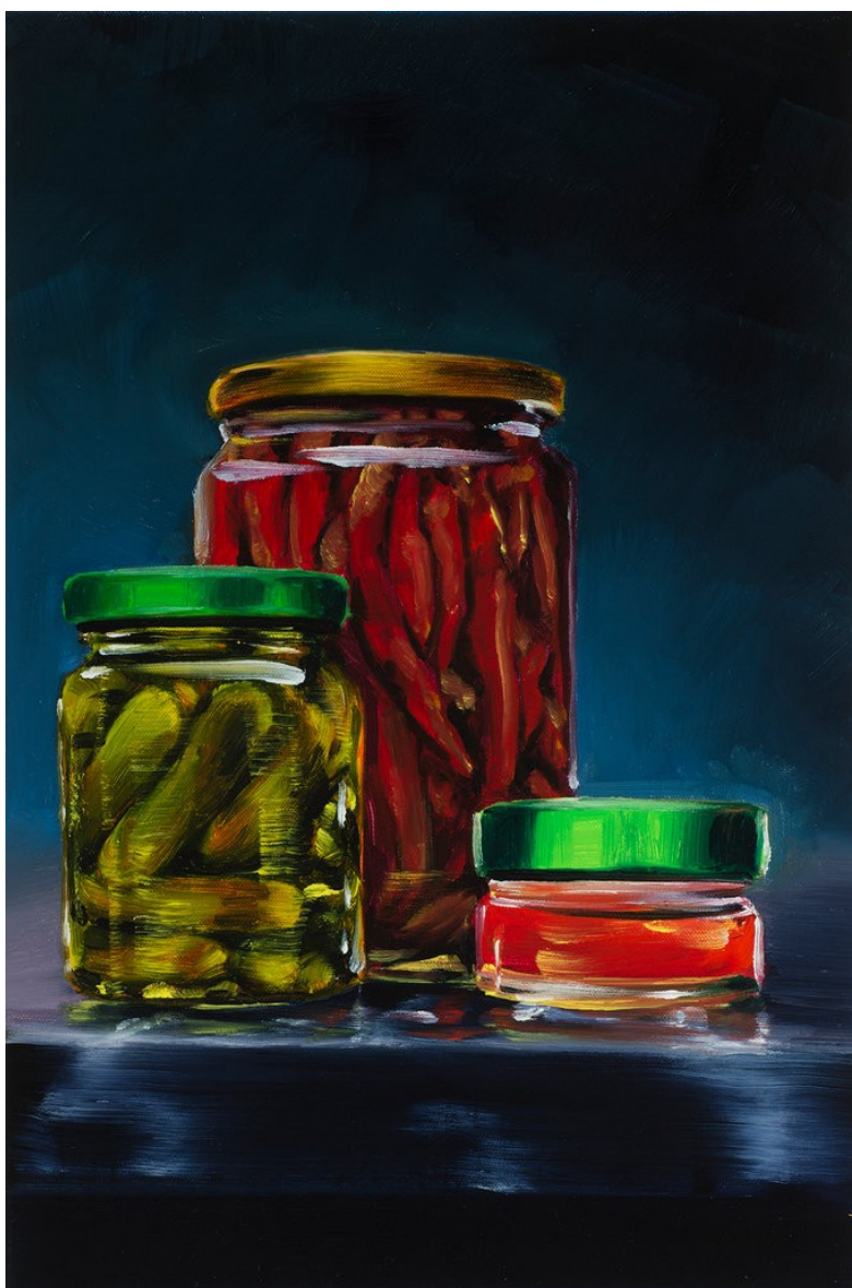
Cornelius Völker Eingelegtes, 2021 Öl auf Leinwand 75 x 50 cm Voel/M 239