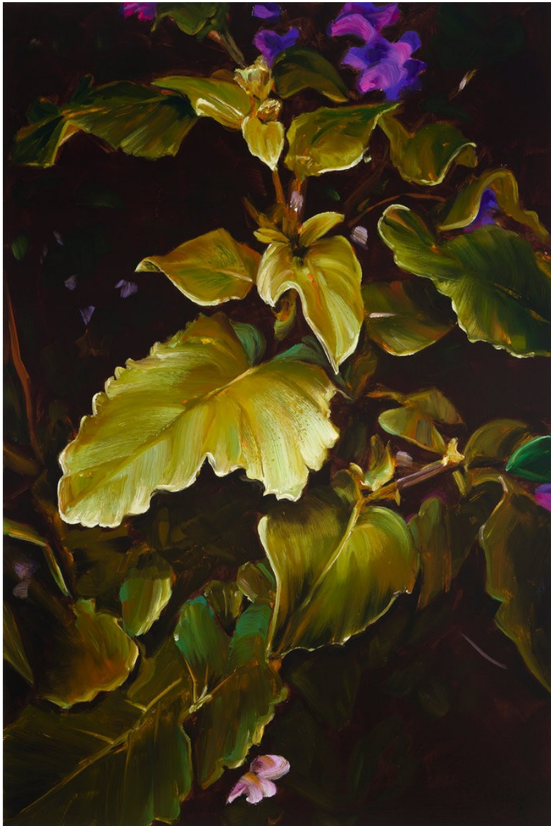
Cornelius Völker Blätter, 2023 Öl auf Leinwand 150 x 100 cm Voel/M 270