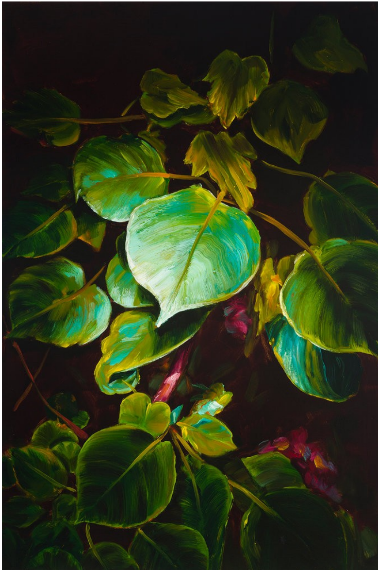
Cornelius Völker Blätter, 2023 Öl auf Leinwand 150 x 100 cm Voel/M 271