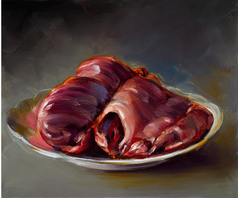
Cornelius Völker Herz, 2023 Öl auf Leinwand 42 x 49 cm Voel/M 248