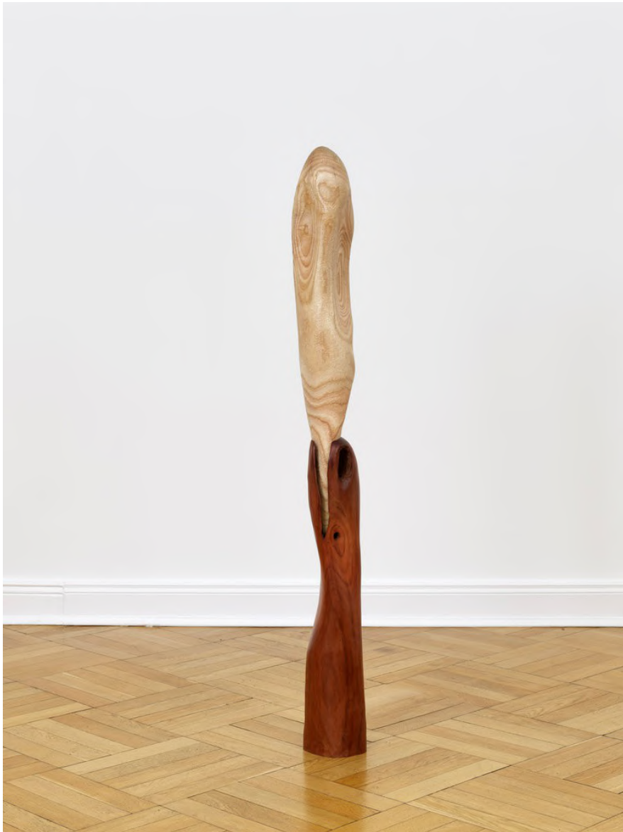
Claire de Santa Coloma Untitled (Prosthesis), 2023 Jacaranda, Quebracho 134 x 15 x 14,5 cm CSC/S 48