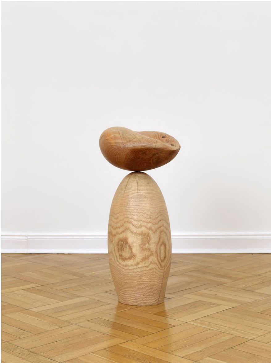
Claire de Santa Coloma Untitled (Sacred), 2023 Libanesisches Zedernholz, Johanniskbrot 86 x 41 x 32 cm CSC/S 45