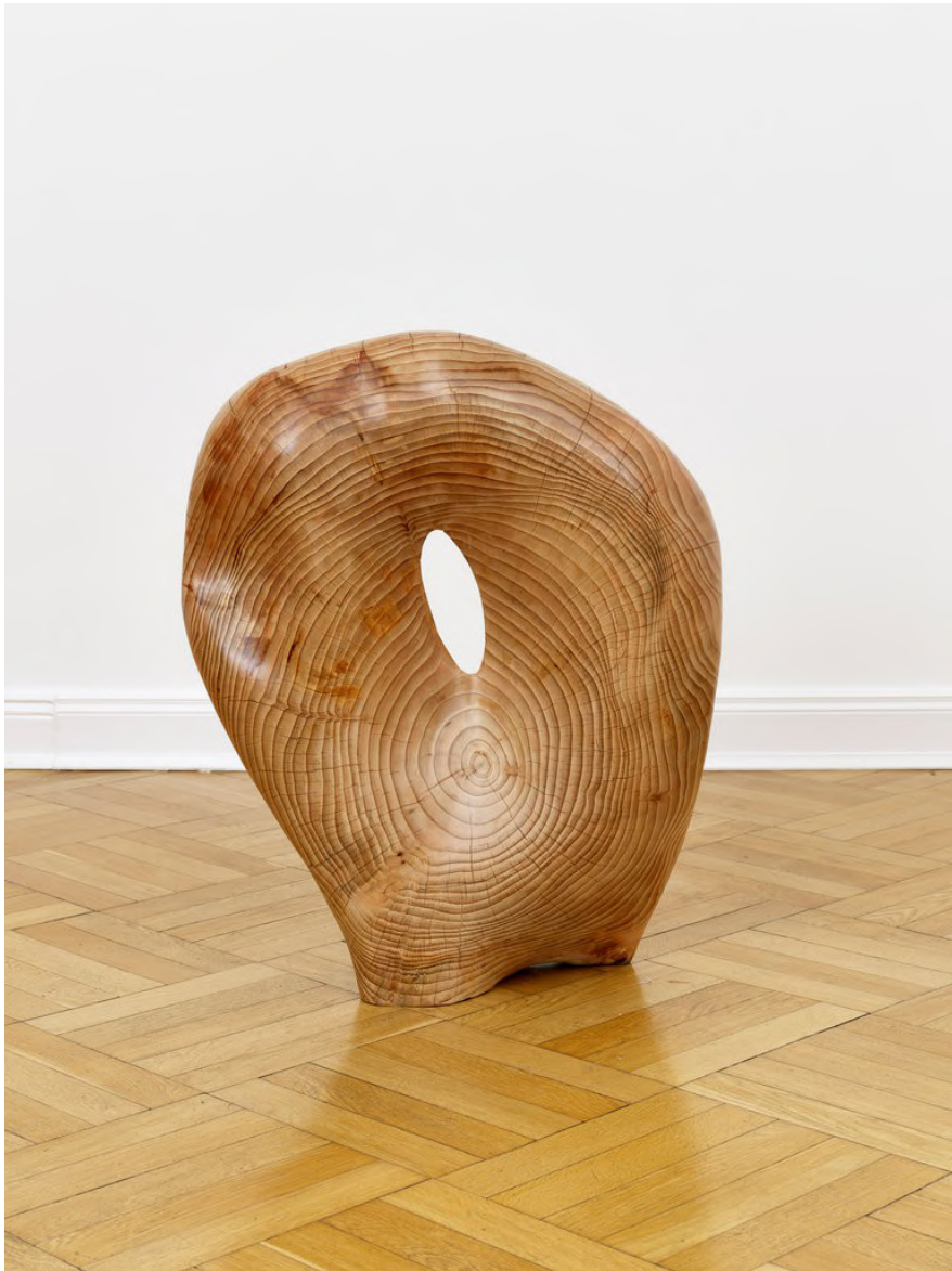
Claire de Santa Coloma Untitled, 2023 Zypresse 79 x 65 x 20 cm CSC/S 53