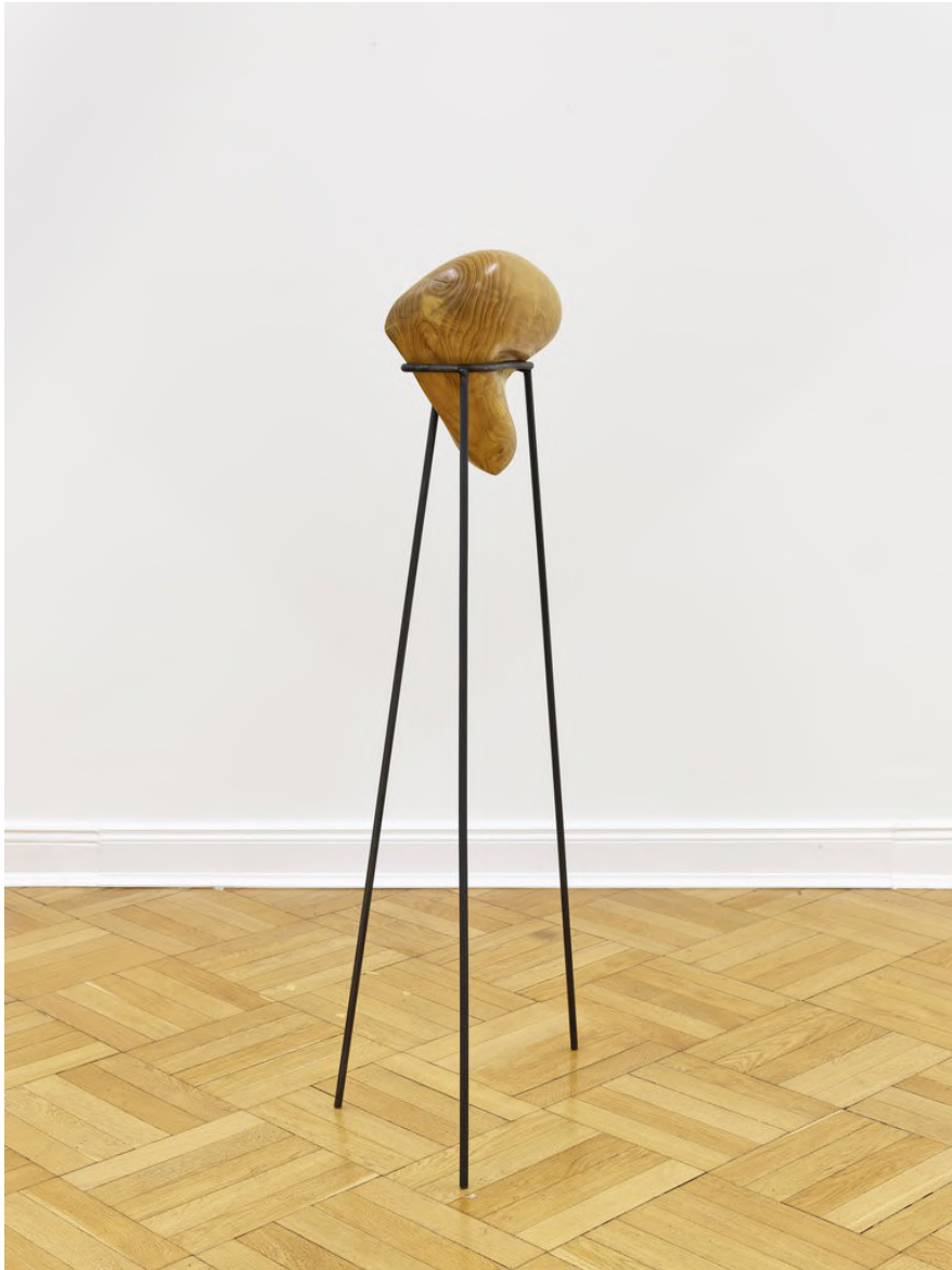
Claire de Santa Coloma Untitled, 2023 Brombeere, Eisen 137 x 57 x 37 cm CSC/S 44