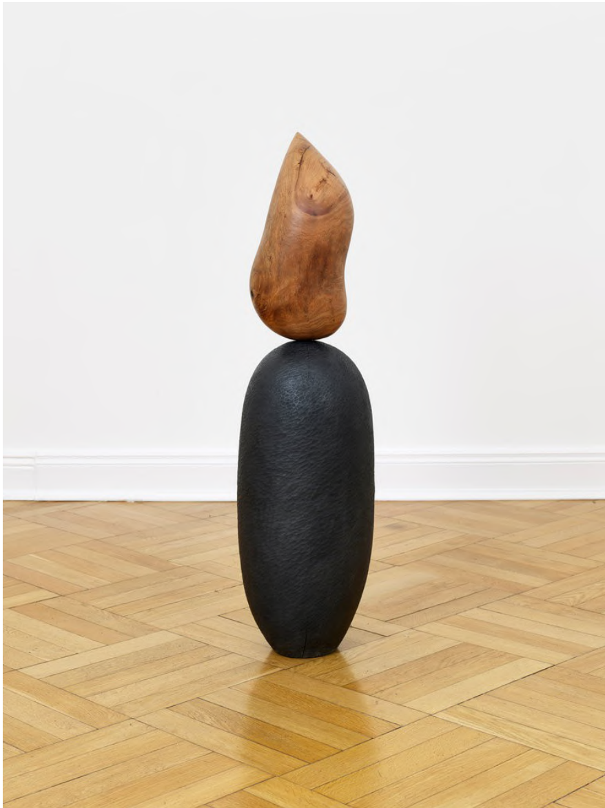
Claire de Santa Coloma Untitled, 2023 Ñandubai, Jacaranda, Graphitpulver 98 x 25 x 25 cm CSC/S 46