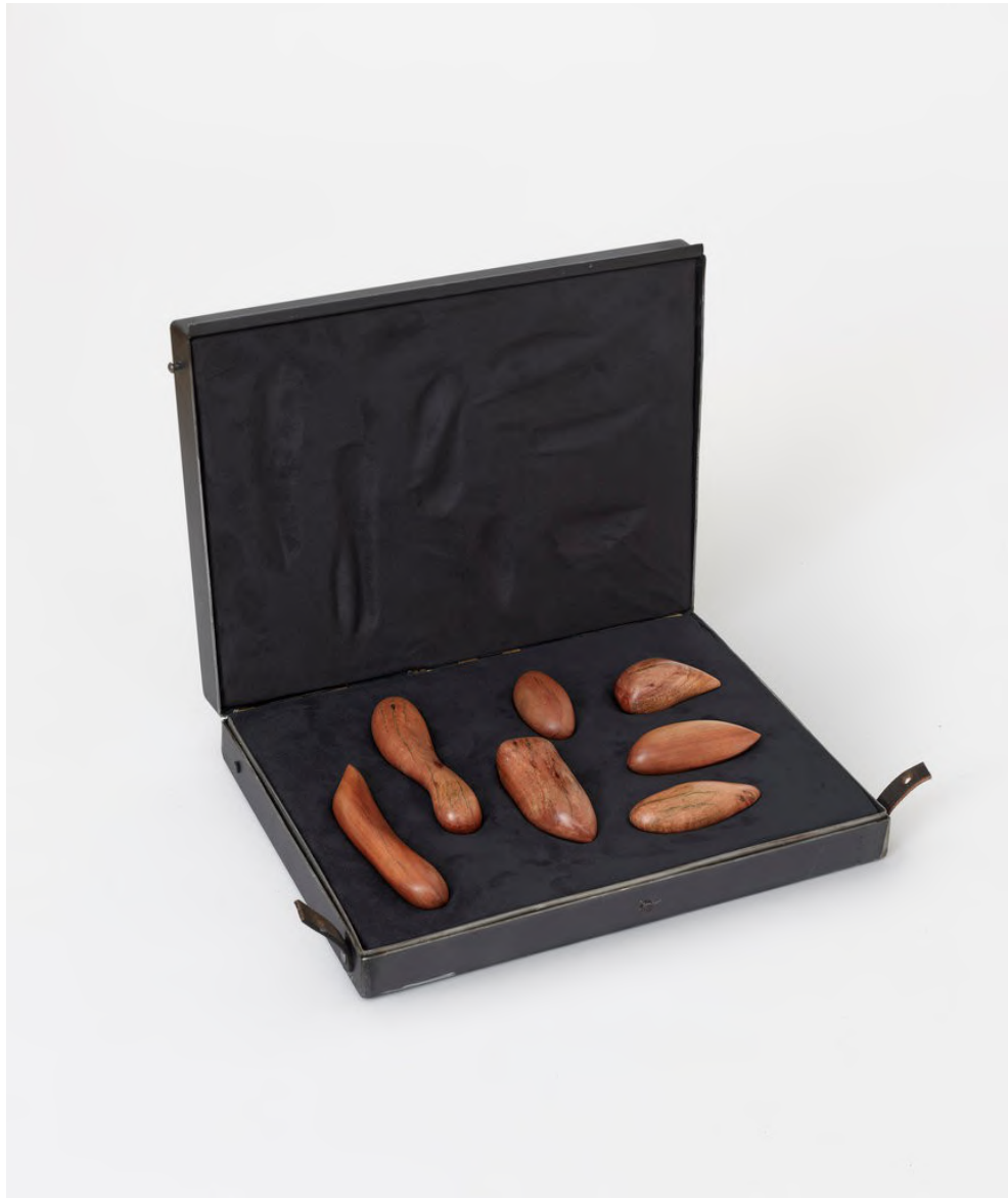
Claire de Santa Coloma Anxiety Sculptures, 2023 Eukalyptus, Eisen, Leder, Schaumstoff, Synthetisches Wildleder 8 x 30 x 40 cm CSC/S 67