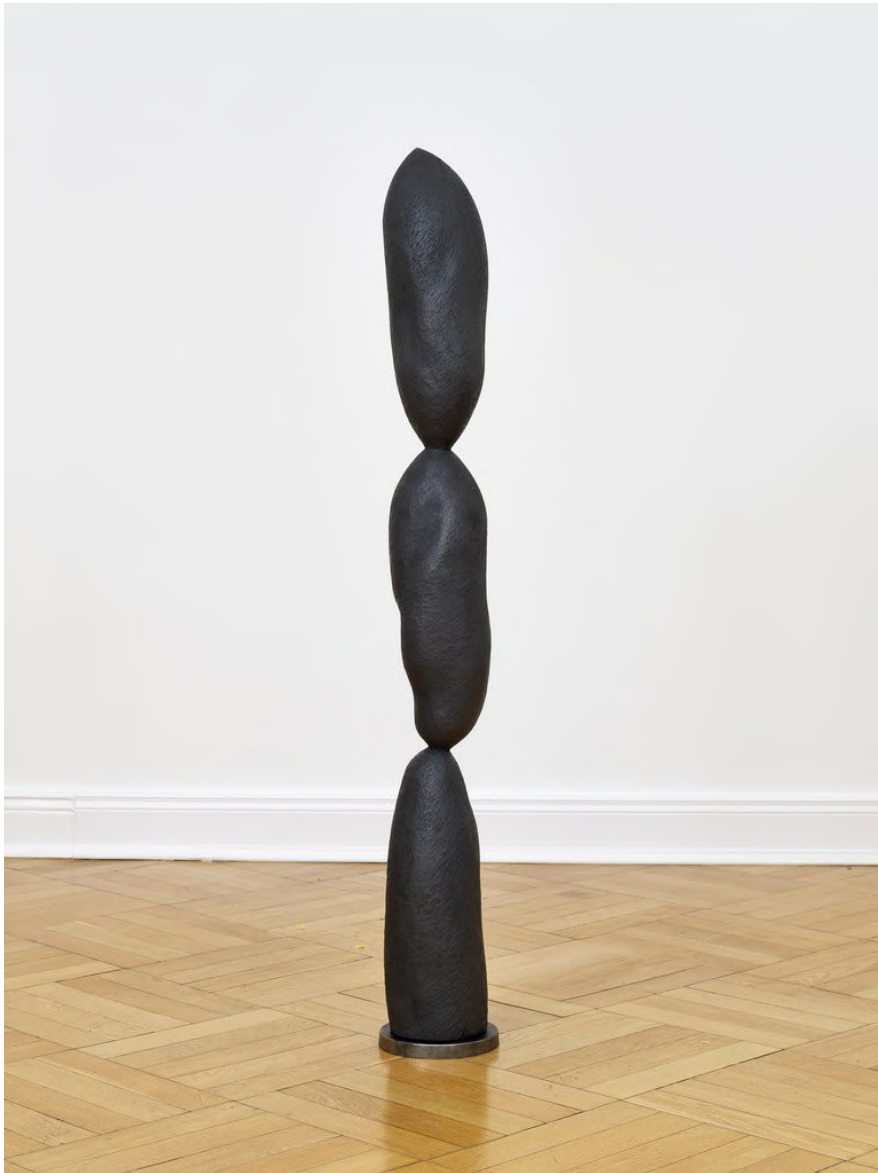
Claire de Santa Coloma Untitled, 2023 Jacaranda, Graphitpulver, Eisen 124,5 x 15,5 x 15,5 cm CSC/S 49