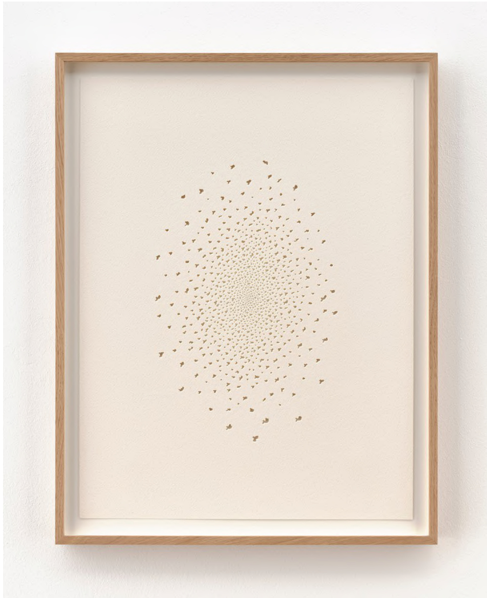
Claire de Santa Coloma Untitled, 2023 Arches-Bütten 41 x 31 cm CSC/P 24