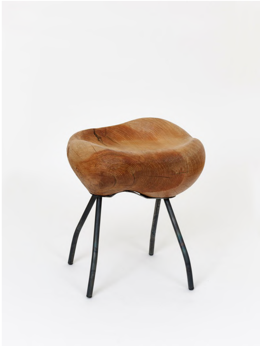
Claire de Santa Coloma Untitled, 2023 Libanesisches Zedernholz, Eisen 54 x 38 x 49 cm CSC/S 50