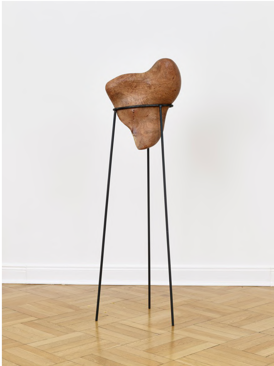
Claire de Santa Coloma Untitled, 2023 Johannisbrotbaum, Eisen 150 x 45 x 43 cm CSC/S 42