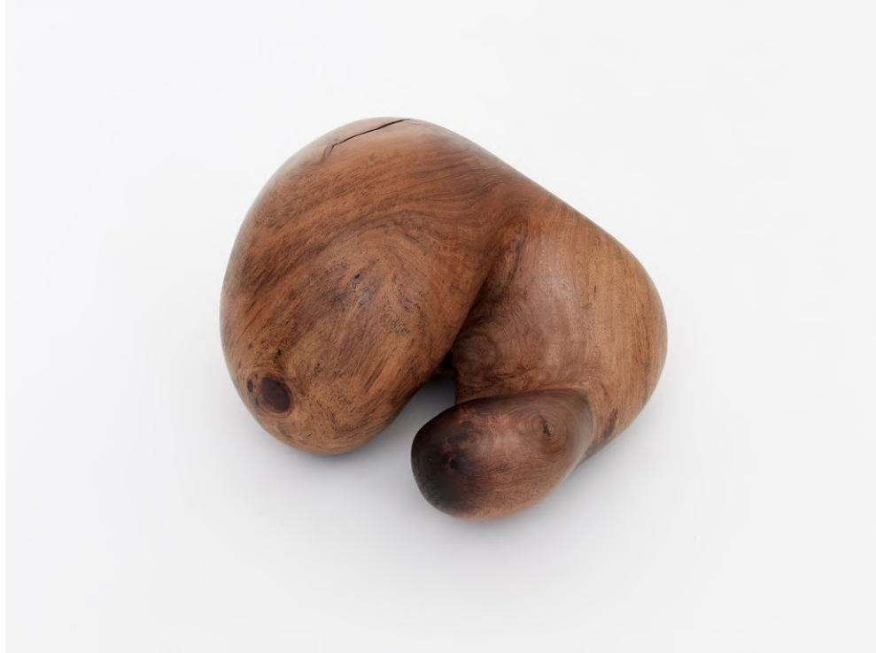
Claire de Santa Coloma Untitled (Petting Sculpture), 2023 Schwarzer Johannisbrotbaum 22 x 35 x 28 cm CSC/S 56