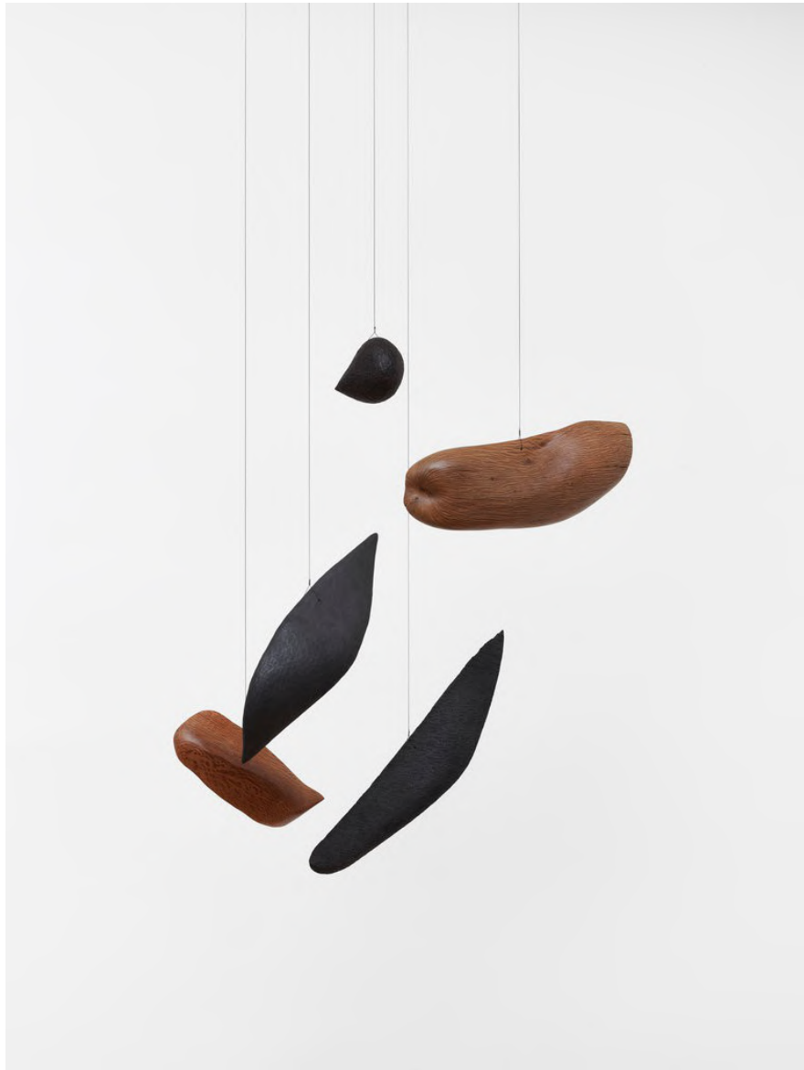
Claire de Santa Coloma Suspended Sculpture, 2021 Europäischer Zürgelbaum, Steineiche, Panga Panga, Graphit ca. 70 x 80 cm, Höhe variabel CSC/S 41