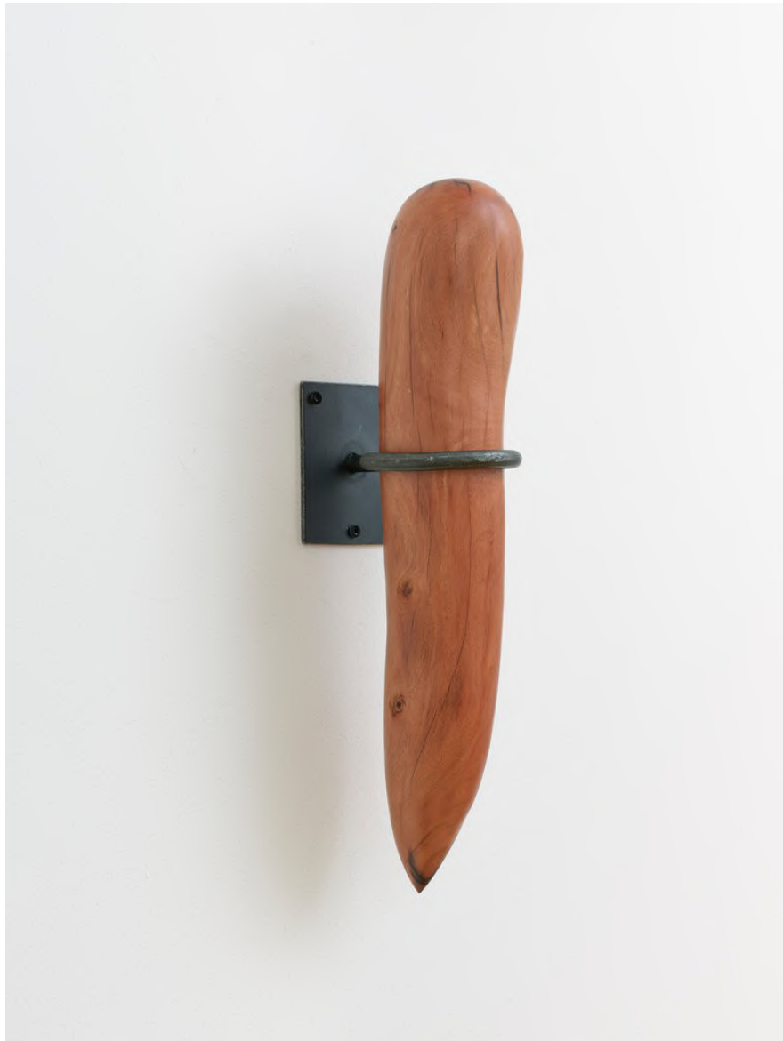
Claire de Santa Coloma Untitled (Soft and Hard), 2023 Quebracho, Eisen 51,5 x 10 x 10 cm CSC/S 57