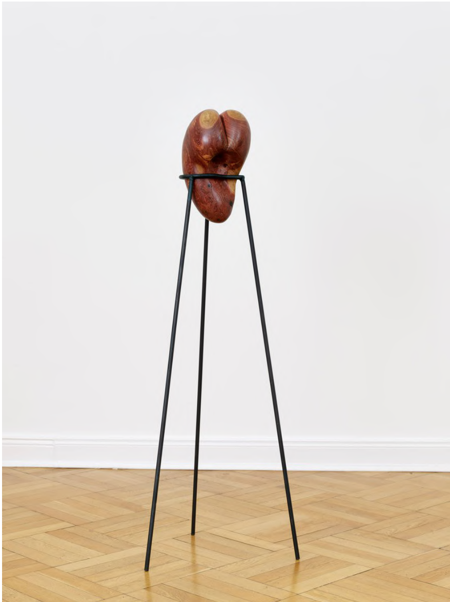
Claire de Santa Coloma Untitled (Heart), 2023 Kronwicke, Eisen 141 x 49 x 44,5 cm CSC/S 43