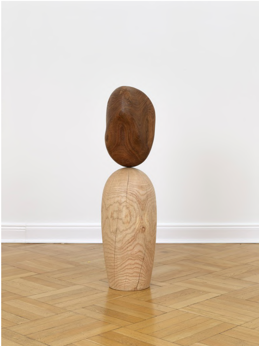
Claire de Santa Coloma Untitled (Portrait), 2023 Johannisbrotbaum, Esche 105 x 28 x 29 cm CSC/S 47