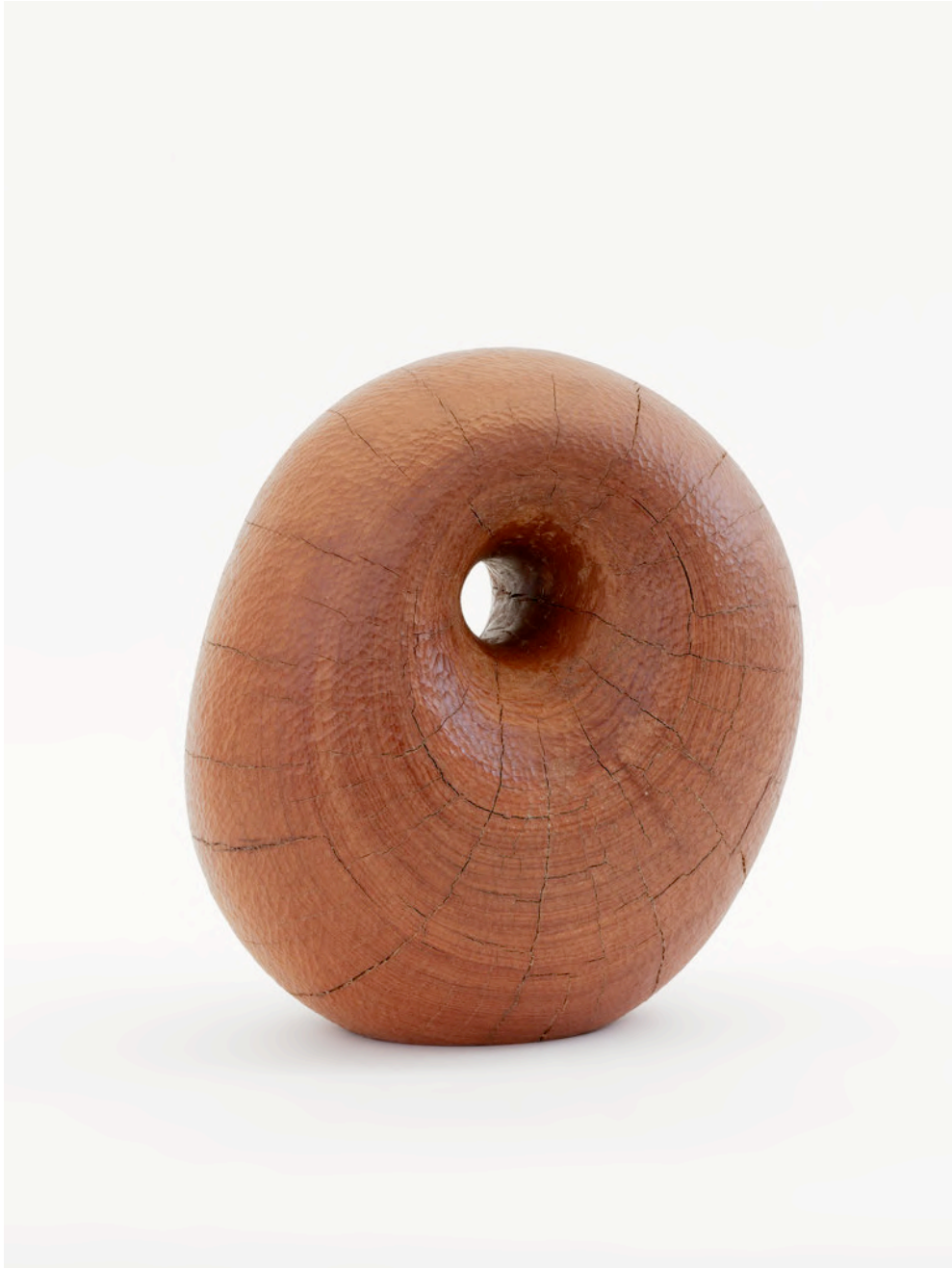
Claire de Santa Coloma Untitled (Hole), 2021 Roter Eukalyptus 32,5 x 20 x 30 cm