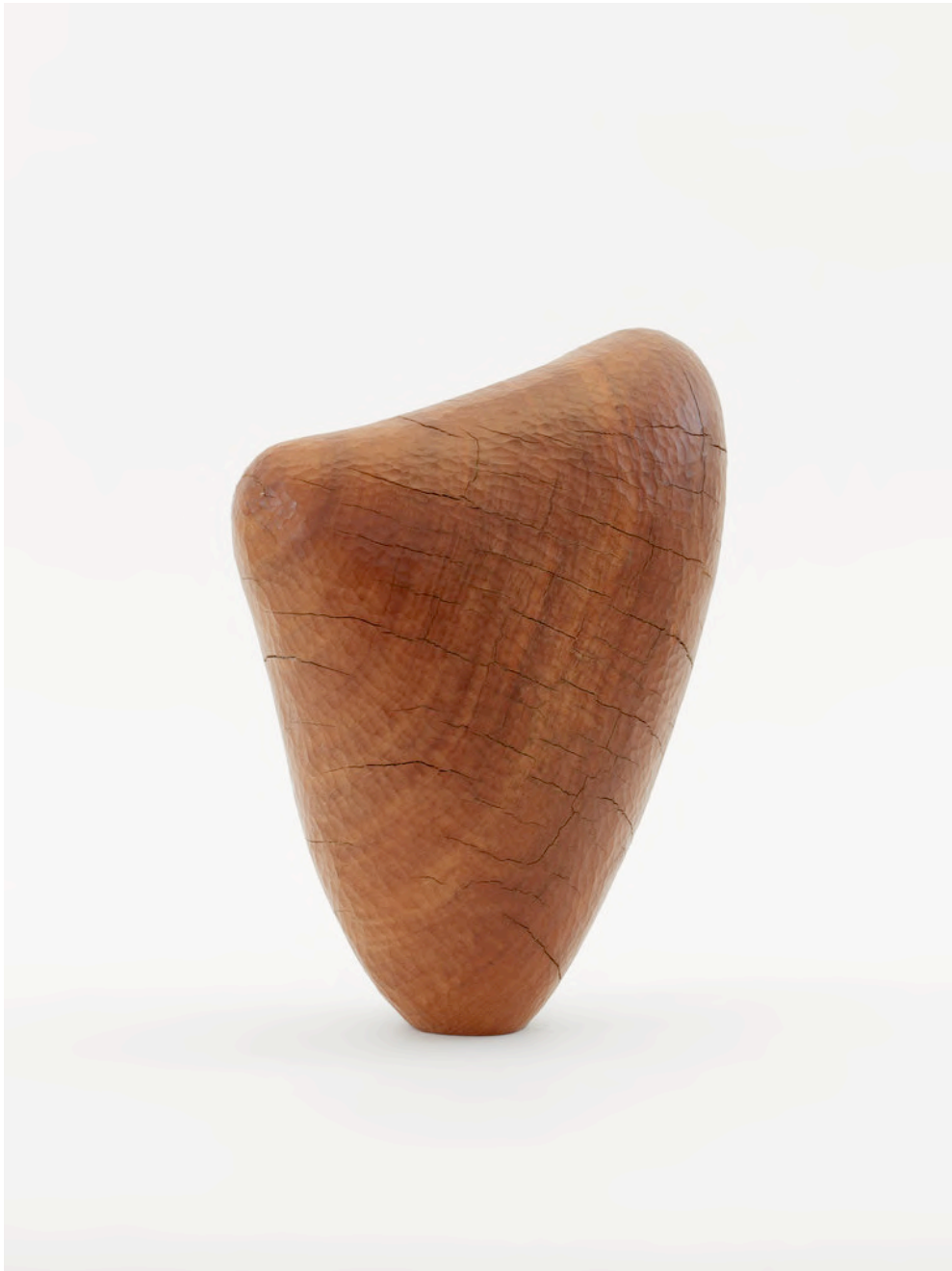
Claire de Santa Coloma Untitled, 2021 Roter Eukalyptus 32,5 x 15 x 23,5 cm