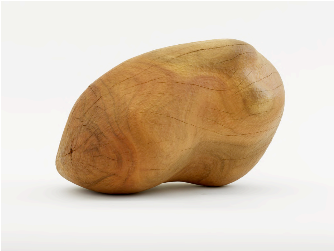
Claire de Santa Coloma Untitled (Torso), 2021 Eukalyptus 30 x 46 x 30 cm