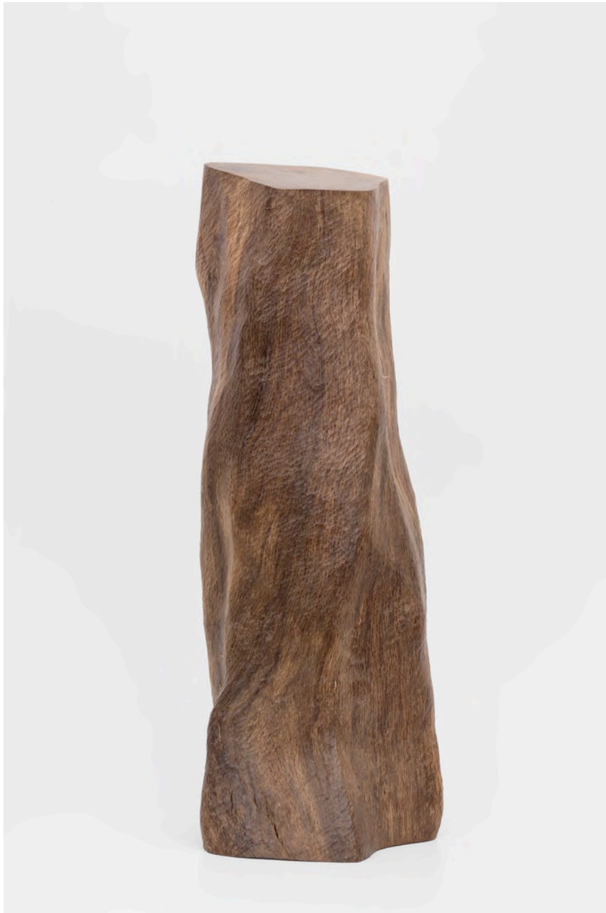
Claire de Santa Coloma Ohne Titel, 2016 Steineiche 40 x 15 x 10 cm