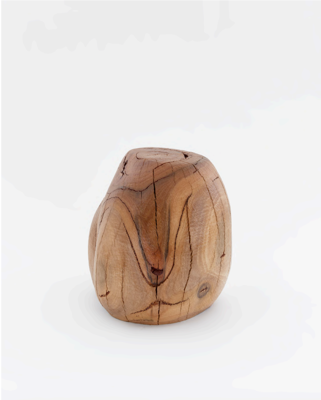
Claire de Santa Coloma Untitled (Stool), 2021 Eukalyptus 34 x 34,5 x 32 cm CSC/S 20