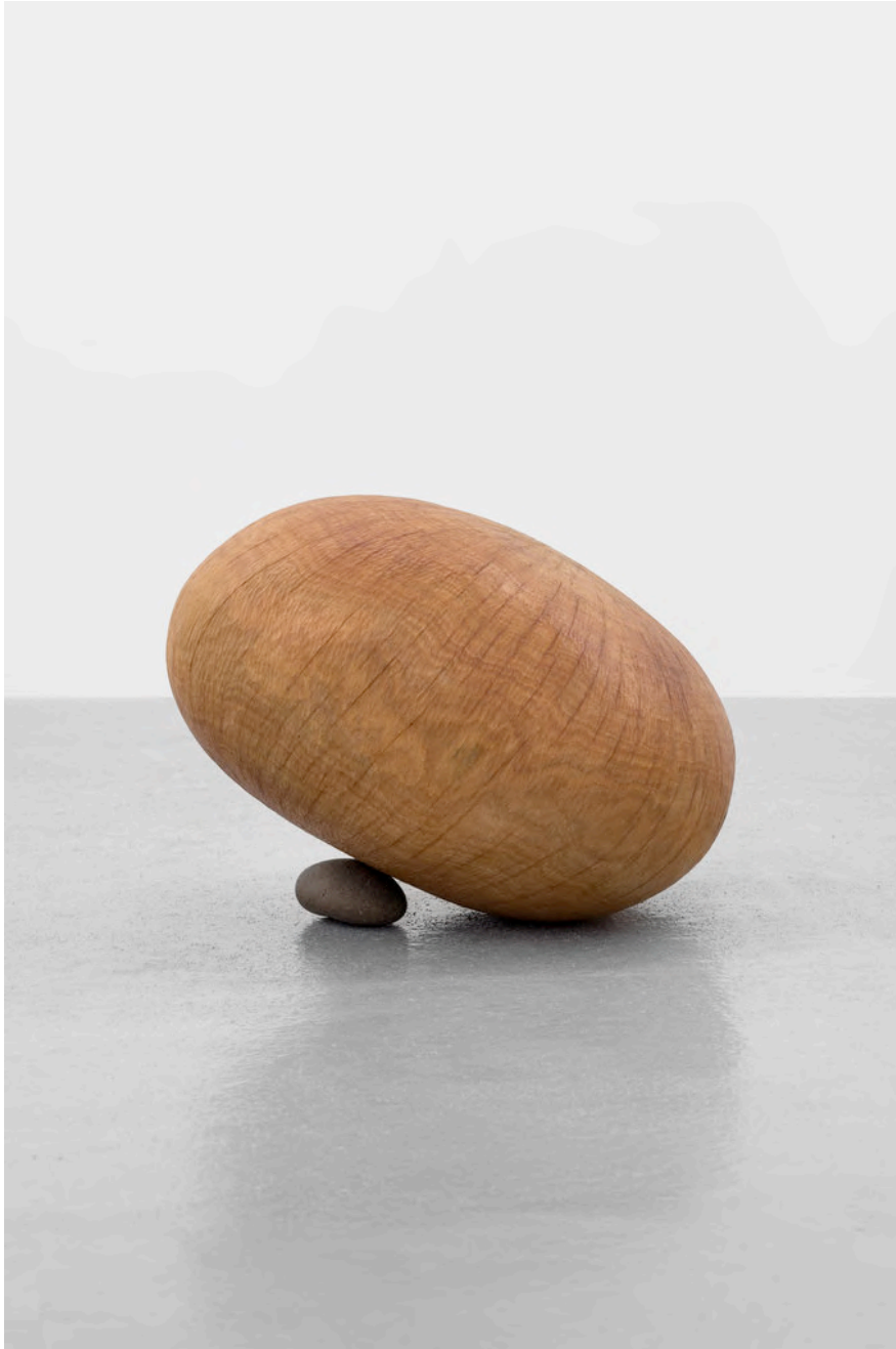
Claire de Santa Coloma Sculpture With Stone, 2018 Araucaria, gefundener Stein aus den Anden Precordillera 34 x 49 x 52 cm