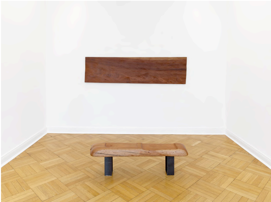
Claire de Santa Coloma Bench for Contemplation, 2017 Sapeli, Kirsche, Stahl 62 x 229 x 3,5 cm und 41 x 32 x 140 cm, zweiteilig